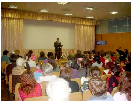
Это собрание Свидетелей Иеговы в Набережных Челнах 21 февраля 2009 года было грубо прервано сотрудниками ФСБ и милиции.