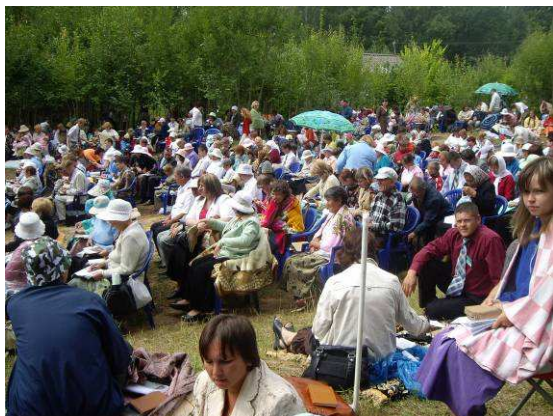
Свидетели Иеговы проводят богослужения в лесу, как во времена запрета в СССР. Неужели история повторяется?