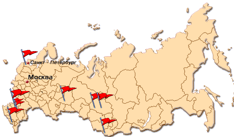
Карта России с указанием мест, где Свидетели Иеговы сталкиваются с особенно сильным преследованием

В согласии с библейским указанием, Свидетели Иеговы по всему миру продолжают молиться о том, чтобы их многострадальные соеврующиеся из России могли вести «спокойную и тихую жизнь в полной преданности Богу» (1 Тимофею 2:2). Они надеются, что нынешние российские власти, совместно с мировым сообществом не допустят повторения трагических уроков истории.