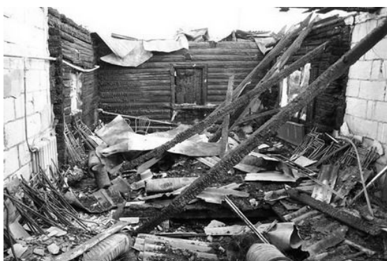
В России не пресекается религиозная нетерпимость по отношению к Свидетелям Иеговы.