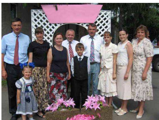
Сегодня, в кругу семьи с детьми и внуками.

■ Впервые в Российской империи Свидетели Иеговы (тогда Международные исследователи Библии), были зарегистрированы в 1913 году. Однако в советское время они столкнулись с сильнейшим противодействием. В 1951 году тысячи Свидетелей Иеговы из западных районов СССР были насильно переселены в Сибирь. С 1957 по 1967 годы их подвергали усиленной психологической обработке в мордовских лагерях. Вплоть до 1985 года продолжались аресты, конфискация религиозной литературы, срывы богослужений. Зачастую, в основу обвинительных приговоров ложились не конкретные нарушения законодательства, а псевдонаучные «религиоведческие» экспертизы. Все это время власти активно использовали СМИ и даже художественные фильмы для создания негативных представлений о Свидетелях Иеговы среди общественности.